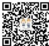
請掃大江校服 微信號二維碼

如有查詢可致電 26719981 或 微信 、 Whatsapp ，另有學生配件。歡迎查詢或在 微信 朋友圈內瀏覽選購，多謝惠顧!