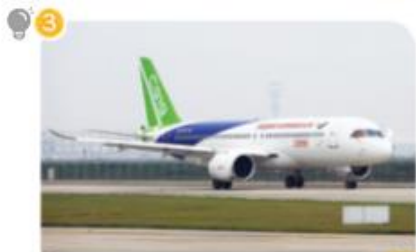
大型噴射式民用飛機C919