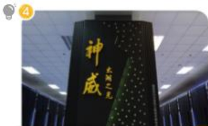
超級電腦「神威·太湖之光」