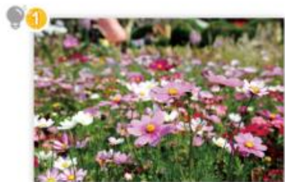
春季 A, B