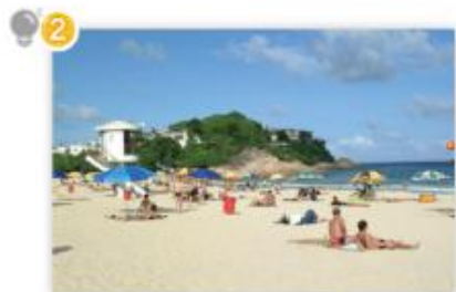
夏季 C, F