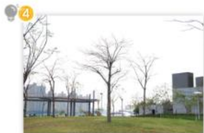
冬季 D, E

【塗色】香港的四個季節主要分佈在哪些月份？在相應的月份塗上指定的顏色。（春季塗綠色；夏季塗藍色；秋季塗黃色；冬季塗紅色。）