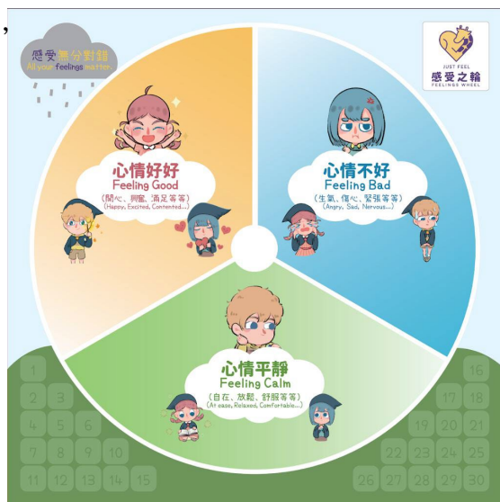
（一至二年級家長適用）

另外，於家長日當天亦設有「感受之輪」體驗活動，有關感受之輪分為一至二年級家長用及三至六年級家長用（見附圖），與 貴子女課室門外的設置內容相同。家長和子女到校後可於大堂位置的設置進行體驗，按自己的當刻的感覺以貼紙進行標示，希望藉此增加對自身感受的覺察。